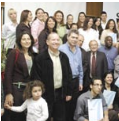
פתיחת סטרייב בתל אביב.

הפועלות במסגרת תביית (תנופה בתעסוקה) – יוזמה משותפת של ממשלת ישראל וג'וינט ישראל, ששמה לה למטרה לקדם השמה בעבודה וקידום תעסוקה בקרב אוכלוסיות חלשות. התכנית פועלת בשיתוף הביטוח הלאומי, עיריית תל אביב ועיריית חיפה. התכנית החלה לפעול בתל אביב ולאור הצלחתה נפתח לפני כחודשיים סניף נוסף בחיפה. בקורס נוסף, שייפתח בחודש יולי הקרוב, ישתתפו 30 אנשים. ההשתתפות בתכנית היא ללא תשלום.