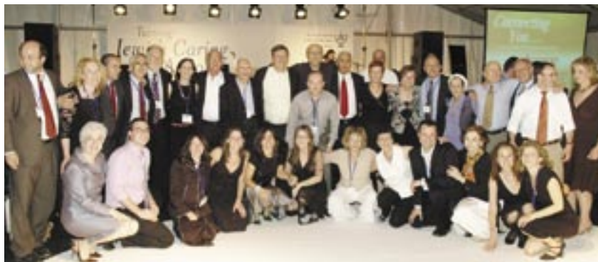
צילום קבוצתי.

השבוע שבילו חברי מועצת המנהלים בישראל היה גדוש אירועים והצלחתו היא תוצאה של עבודת הכנה, שנמשכה קרוב לשנתיים, שנעשתה על ידי חברי הנהלת גוינט ישראל והעובדים.