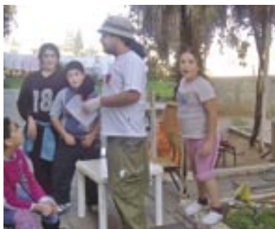
פיסול סביבתי בשדרות

השכונה) לצד ישראלים ותיקים, יהודים וערבים. השכונה כוללת 20 בניינים אשר רק בשניים מהם פעלו ועדי בתים. ועדים אלה היוו את הבסיס לתחילת העבודה. בין היתר הם קיבלו ייעוץ והכוונה בנושאים כמו: אסיפות דיירים, פיתרון סכסוכי שכנים ושיפוץ פיזי של אזור המגורים. תוצאות העבודה, שכבר ניכרות בשטח, סייעו בכניסת התכנית גם לבניינים נוספים.