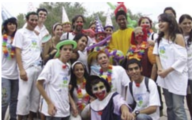
"מחזירים את החיוך לצפון" – פעילות מתנדבי עמ"ץ לאחר המלחמה

הערכה: במאיירס גיוינט-מכון ברוקדייל נערכים להערכת הפעילות המתבצעת בכספי החירום. ההערכה, המשותפת לתכניות הגיוינט והסוכנות היהודית, היא עבור איחוד הקהילות היהודיות, והיא תיעשה גם לגבי אופי הפעילות והשפעתה על התושבים. ♦