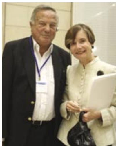
השופטת אלן הלר, נשיאת הג'וינט העולמי ודב לאוטמן, חתן פרס ישראל

גם המשיבים הישראלים לא טמנו ידם בצלחת. "אל תשוו בין המימדים של ההון שלכם לזה שלנו", אמר חתן פרס ישראל לשנה זו, דב לאוטמן (ובסוגריים – הבעיה שאת רוב הכסף אתם בכלל נותנים למטרות גלובליות).