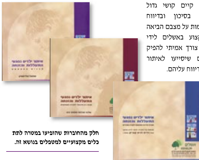
חלק מהחוברות שהופיעו במטרה לתת כלים מקצועיים למטפלים בנושא זה.

העובדה שעדיין קיים קושי גדול באיתור ילדים בסיכון ובדיווח לרשויות המתאימות על מצבם הביאה את אנשי המקצוע באשלים לידי הכרה, כי קיים צורך אמיתי להפיק חומרים כתובים שיסייעו לאיתור ילדים בסיכון ולדיווח עליהם.