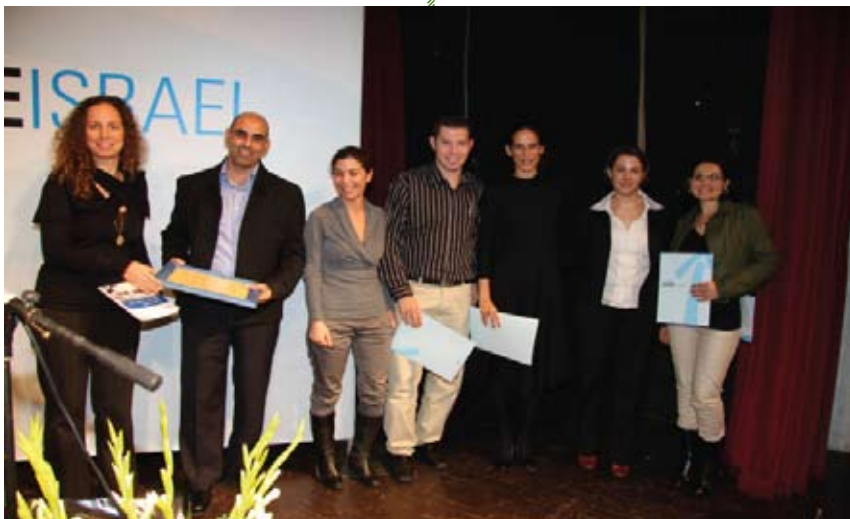
צוות סטרייב ישראל מעניק תעודות גמר למסיימי התכנית באירוע הארצי שנערך בירושלים.

סטרייב ישראל היא תכנית חברתית ייחודית של תב"ת - ג'וינט ישראל, המכשירה צעירים, נשים וגברים, בגילאים 21 עד 40, שאינם מועסקים למעלה מחצי שנה, אינם מקבלים קצבת אבטלה ולא זכו להשכלה אקדמית, לפיתוח קריירה