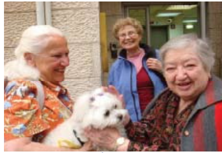
זקנים וחיות מחמד בירושלים במסגרת התכנית "חברים בעת זיקנה"

המוקד החדשני פועל במסגרת התכנית "חברים בעת זיקנה" של אשל - ג'וינט ומתוך הכרה, כי חיות המחמד ממלאות בחייהם של הזקנים תפקיד חשוב. מחקרים מראים, כי חיות המחמד ממלאות תפקיד חשוב בחייהם של הזקנים.